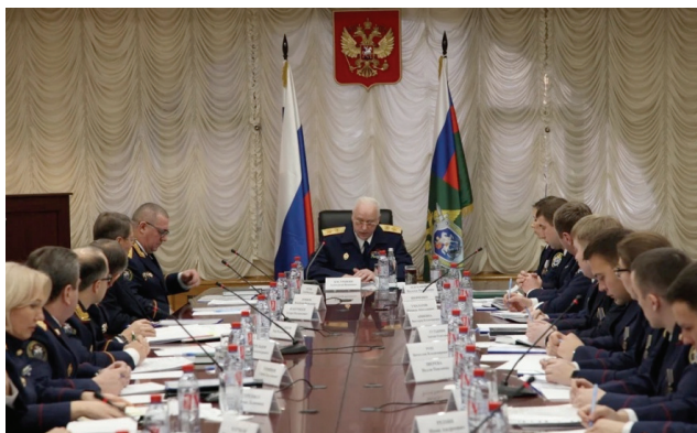
Заседание Совета молодых следователей в Следственном комитете РФ

сических юристов, как правило, даже если они выбирают уголовно-правовую специализацию, не учат тем азам, которые пригодятся в профессии следователя – как правильно снимать отпечатки пальцев, грамотно составить протокол, допросить свидетеля или осмотреть место происшествия. На классических юрфаках зачастую не хватает практической составляющей, которая является краеугольным камнем для выбора молодыми людьми специализации.