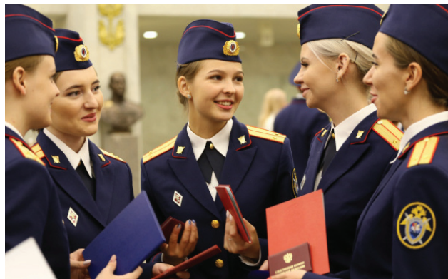
Выпускницы Московской академии

ответственно. А тем, кто решил связать свою жизнь со следствием, могу посоветовать только учиться, учиться и еще раз учиться, чтобы овладеть всеми тонкостями следственной науки. Приобретайте знания, слушайте советы опытных коллег, развивайте в себе необходимые для этой профессии качества. Следователи – охранители прав граждан: требования к работе следователей, особенно к их моральному и нравственному облику, всегда были очень высоки. Этим критериям нам необходимо соответствовать в полной мере. Следственная работа – не для каждого. Но если вы сами выбрали эту стезю, – вы сами определили для себя жизненный путь служения Отечеству.