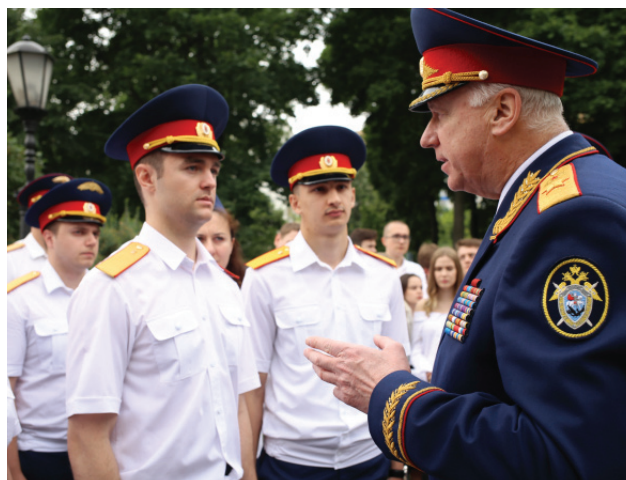
Председатель СК России А.Бастрыкин со студентами Московской академии Следственного комитета Российской Федерации

– Следователь, прежде всего, – юрист, и на него распространяются такие же принципы юридического образования – широта кругозора, хорошее знание права, умение ориентироваться в нормативно-правовой базе. Клас-