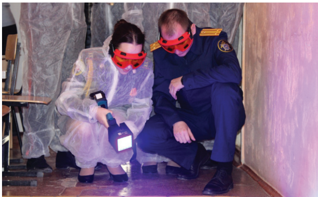
В процессе обучения

дованию преступлений в медицинской сфере, бандитизма, преступлений прошлых лет, международного и федерального розыска лиц.