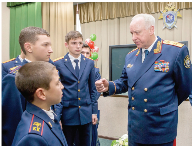
Председатель СК России Александр Бастрыкин с кадетами и студентами

Санкт-Петербургского корпуса в Севастополе, 38 кадетских классов по всей стране. По инициативе Следственного комитета, Клуба Героев Российской Федерации и ветеранов следствия нами создана Межрегиональная общественная организация «Молодежный союз «Юный следователь». Дети активно вовлечены не только в следственную работу в рамках учебы, но патриотическую. Мы прививаем ребятам правильные ценности – любовь к Отечеству, уважение российской истории и культуры, наших ветеранов. Сейчас особенно важно отвлечь молодое поколение от того, что происходит на телевидении и на просторах Интернета – жестокость, пропаганда чуждых нашему мировоззрению понятий, откровенная фальсификация исторической правды.