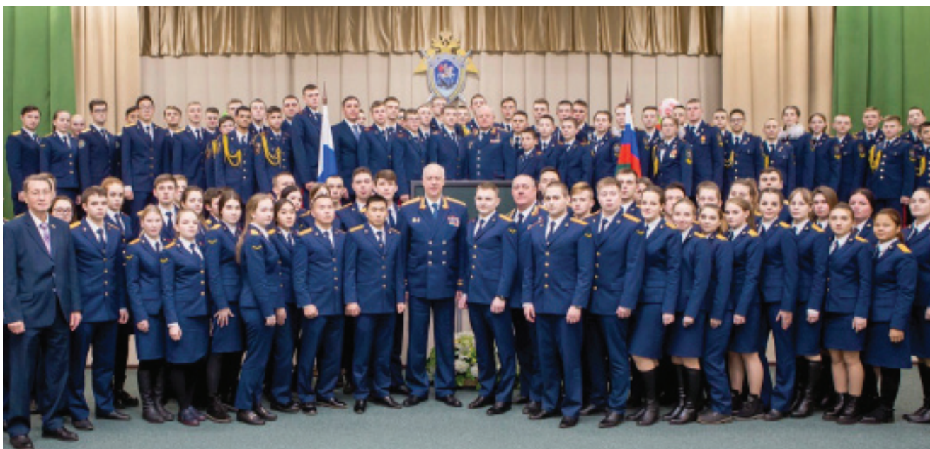
Председатель СК России А.Бастрыкин со студентами Московской академии Следственного комитета Российской Федерации

Библиографическое описание: интервью номера: Бастрыкин А.И. Кадры решают все! / А.И. Бастрыкин; И.В. Панова [интервью] // Публичное право сегодня. – 2020. – № 2. – С. 5–14 УДК 343.8