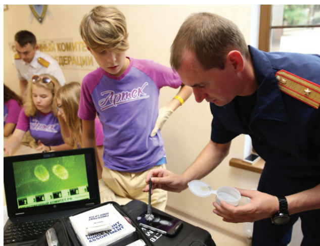
Программа «Юный следователь»

Санкт-Петербургского корпуса в Севастополе, 38 кадетских классов по всей стране. По инициативе Следственного комитета, Клуба Героев Российской Федерации и ветеранов следствия нами создана Межрегиональная общественная организация «Молодежный союз «Юный следователь». Дети активно вовлечены не только в следственную работу в рамках учебы, но патриотическую. Мы прививаем ребятам правильные ценности – любовь к Отечеству, уважение российской истории и культуры, наших ветеранов. Сейчас особенно важно отвлечь молодое поколение от того, что происходит на телевидении и на просторах Интернета – жестокость, пропаганда чуждых нашему мировоззрению понятий, откровенная фальсификация исторической правды.